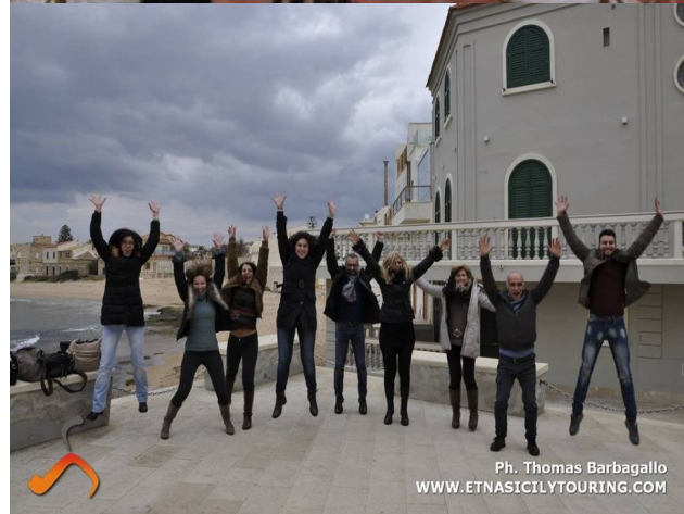
Ph. Thomas Barbagallo WWW.ETNASICILYTOURING.COM

The activity will be confirmed or canceled 24 hours before departure Info - Booking - Pick up e Drop off - Via G. Garibaldi, 39